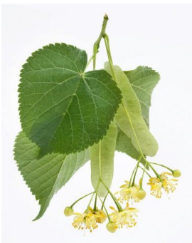
TIGLIO – Tilia cordata