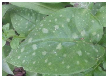
POLMONARIA - Pulmonaria officinalis