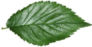
OLMO – Ulmus minor