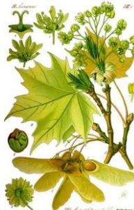
ACERO RICCIO – Acer platanoides