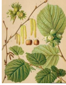
NOCCIOLO – Corylus avellana