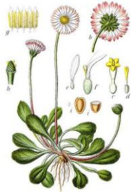
MARGHERITA - Bellis perennis