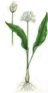
AGLIO ORSINO - Allium ursinum