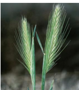
ORZO SELVATICO - Hordeum murinum