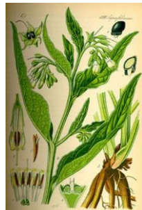
CONSOLIDA - Symphytum officinale