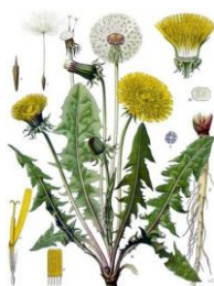
TARASSACO - Taraxacum officinale