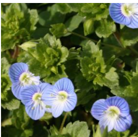
VERONICA, OCCHI DELLA MADONNA - Veronica persica