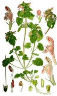
LAMIO ROSSO - Lamium purpureum