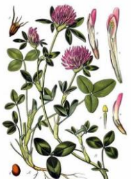
TRIFOGLIO ROSSO - Trifolium pratense