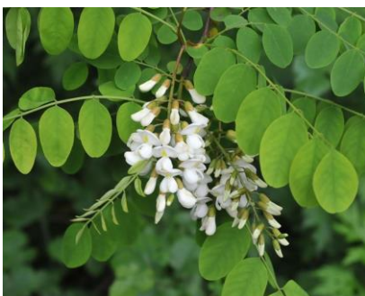
ROBINIA – Robinia pseudoacacia