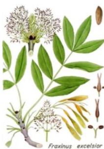
FRASSINO MAGGIORE – Fraxinus excelsior