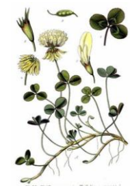
TRIFOGLIO BIANCO - Trifolium repens