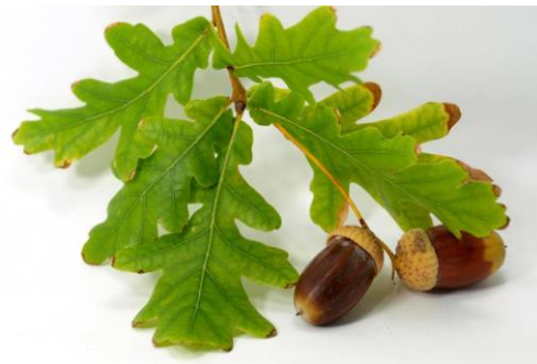
FARNIA – Quercus robur