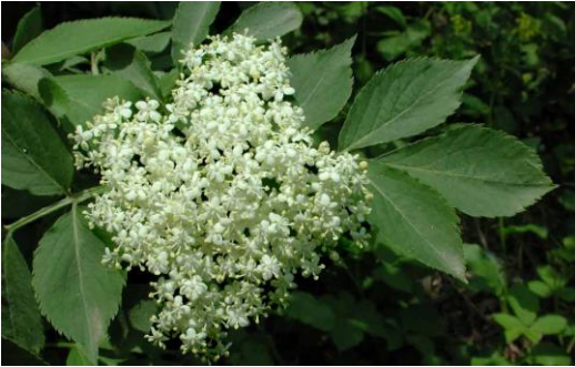
SAMBUCO – Sambucus nigra