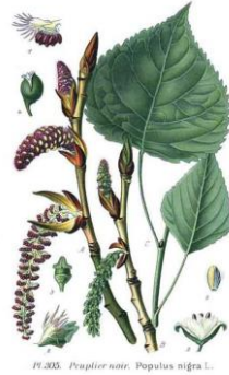
PIOPPO – Populus nigra