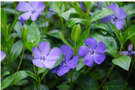
PERVINCA - Vinca minor