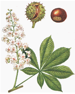
IPPOCASTANO – Aesculus hippocastanum